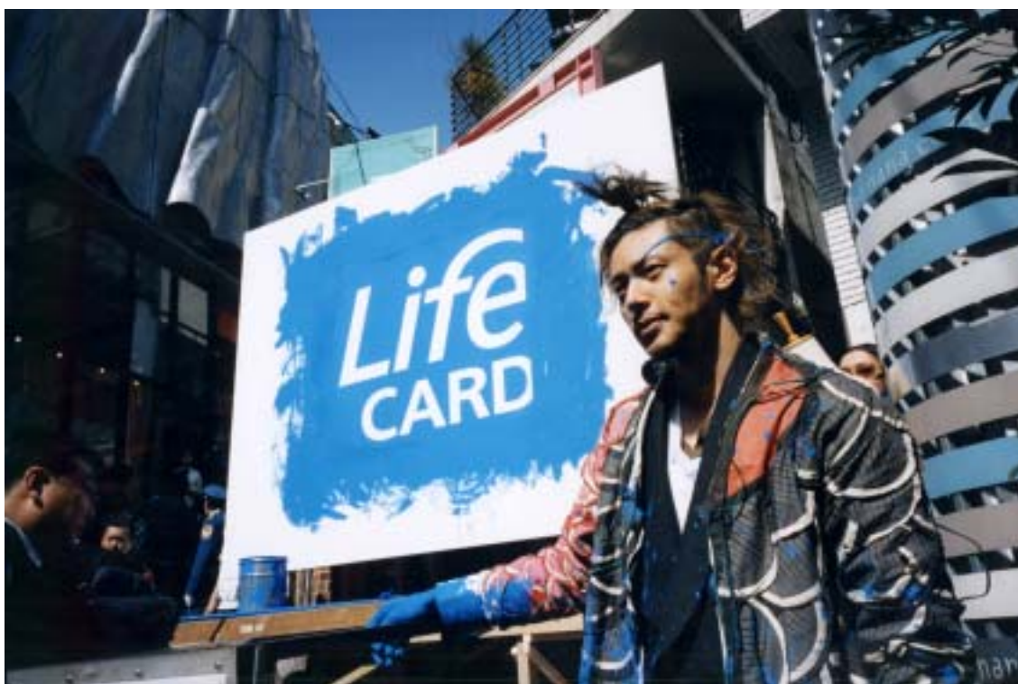
写真 = (株)ライフ『Life Card』TV-CM 「Be Unique! ライブペイント」篇(30秒)より