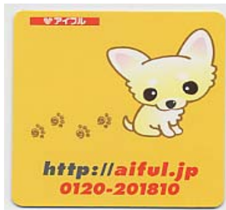
ちわフルマウスパッド (黄・緑の2色)