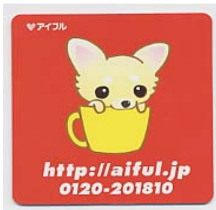
ちわフルマグネットシート (黄・赤の2色)